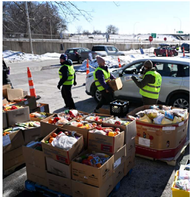
Freiwillige packen im Rahmen der Rapid-response networks in Minneapolis Lebensmittelpakete für Einwanderer, die aus Angst vor Abschiebungen nicht mehr einkaufen gehen können.

Im Rahmen unserer Arbeit haben wir zwei wesentliche Grenzen der Soforthilfe erkannt. Erstens war ein Teil der Soforthilfe Kräfte von Wut und/oder politischen Motiven