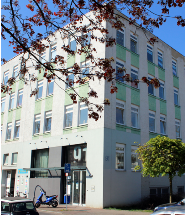
Das Mehrgenerationenhaus Kinder im Zentrum Gallus e.V. in der Idsteiner Str. 91 in Frankfurt-Gallus

in unserem Ansatz zur Lernhilfe, so unterschiedlich diese auch aussehen mögen in den diversen Helfenden.