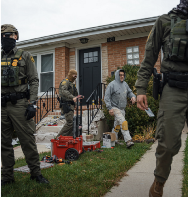
Vermummte Bundesbeamte nehmen an Halloween in Chicago zwei Maler fest.

bungs-Aktivismus im Besonderen passen von Natur aus zu dieser Art von Organisationsarbeit. Das Recht auf Freizügigkeit, das Recht auf Arbeit, das Recht auf Privatsphäre ohne staatliche Einmischung, das Recht auf ein ordnungsgemäßes Verfahren – das sind klassische liberale Anliegen, für deren Schutz und Ausbau sich Sozialisten historisch organisiert haben, und der Anti-Abschiebungs-Aktivismus berührt sie alle. Der Aktivismus gegen Abschiebungen verbindet uns mit der Organisation am Arbeitsplatz, die die bestehende Organisationsarbeit der CSP in Bereichen wie Bildung und Mieterbewegung ergänzt, die die Arbeiter eher als Konsumenten betreffen als direkt in ihrer Rolle als Produzenten. In diesem Sinne geht es bei der Bekämpfung von Abschiebungen wirklich um Arbeit – um die Menschen, die in der Gesellschaft Güter und Dienstleistungen produzieren, und um den besonderen Einfluss, den sie in dieser Rolle haben.