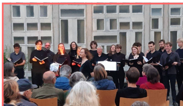
Der Akademische Arbeiterliederchor an der Goethe-Uni Frankfurt bringt Studierende, Beschäftigte und Interessierte zusammen, um Arbeiterlieder zu singen.

Doch mit der Zeit wurde mir ein Repertoire von unglaublicher Fülle und Dichte zugänglich. Wo ich einst in den Chor kam, um vor allem Kampflieder zu singen,