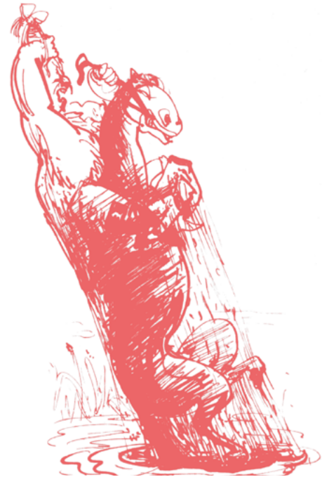
Josef Hegenbarth: Münchhausen zieht sich und sein Pferd an den Haaren aus dem Sumpf, um 1950

Auf der einen Seite wollen wir uns darin üben für die unabhängige Organisation der Interessen der Menschen nützlich zu sein und dadurch nützlich für die Frage des Sozialismus, der Freiheit. Auf der anderen Seite sind wir unschlüssig über das „Wie“ dieses ganzen Zusammen-